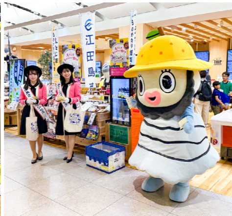
▲さくらプリンセスとえたぼうが「THE OUTLETS HIROSHIMA」で「えも博」をPR