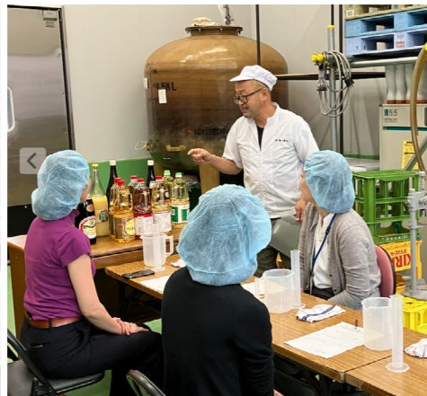
▲「えも博」での体験メニューの様子②