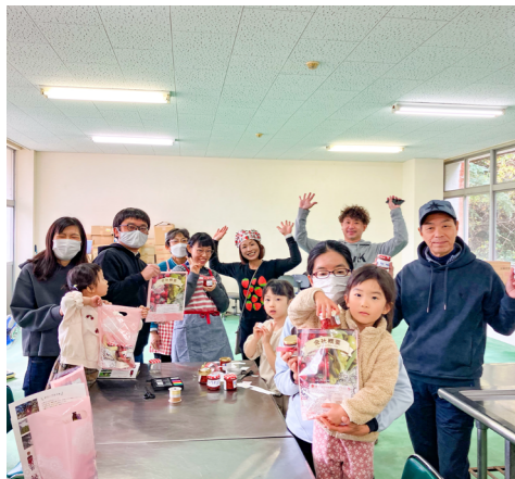
▲「えも博」での体験メニューの様子①