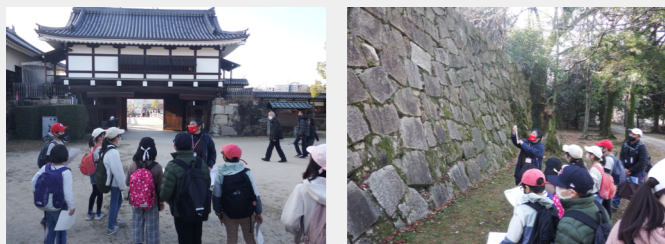
▲トレジャーウォークを楽しむ子どもたち▲