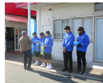
募金活動を行う生徒の様子

中高合同ユニセフ募金活動 令和5年12月23日(土)に、市内中学校の生徒会と大柿高等学校の生徒会の生徒が中心となって、市内4か所のスーパーマーケットの前で募金活動を行いました。この取り組みは、ユニセフ募金のボランティア活動を通して、公共の福祉の精神を高めることを目的に「大柿高校サポート事業」の一環として、例年実施していません。生徒の呼びかけの声に、買い物に来られた方々から「ご苦労さま、頑張ってくださいね」と声をかけていただく場面もありました。今回の活動における募金総額は、18万3631円で、集まったお金は、すべてユニセフへ寄附しました。募金活動を終えた生徒たちは、「地域の方が笑顔で快く協力してくださり、地域の温かさを感じられて嬉しかった。募金したお金は困っている世界の人々に届けたい」と話していました。