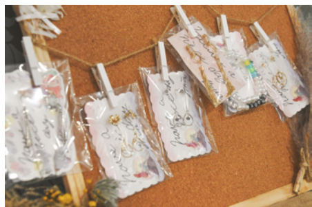
ネイルや歯のホワイトニングの他にもオリジナルアクセサリー販売も! 本文にも記載したように、ヒロエさんの娘さん達もLecielで活躍中。ネイルはこの春始めたばかりの新メニュー! ¥3,000〜と初心者でも施術を受けやすいお手頃価格となっています。その他のメニューも通いやすい値段になっているので、ぜひ気軽にお店に行ってみて。