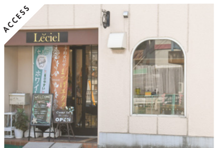
Leciel 江田島市大柿町大原 7145 営業時間: 10:30 ~ 19:00 定休日: 日 電話: 0823-27-7710(完全予約制) Instagram [Leciel0522] で検索してみてください!