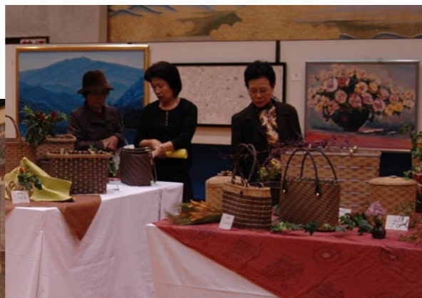
大柿美術作品展(写真上)と江田島市文化協会作品発表会(写真左)の様子