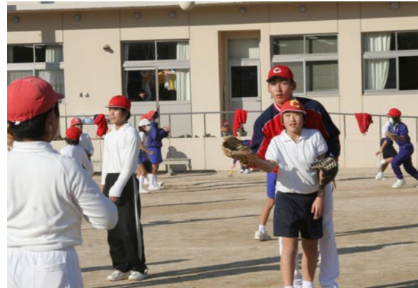
12/2(水) カーブ6選手が江田島へ (大古小学校)

広島東洋カーブの安部友裕選手、岩本貴裕選手、小松剛選手、篠田純平選手、白濱裕太選手、丸佳浩選手の6人が来訪。大古小学校の児童と一緒に給食を食べたり、市内の小学生と野球教室を行ったりして楽しい時間を過ごしました。