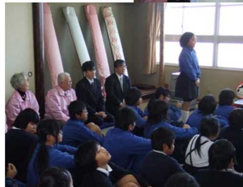
人権週間に人権擁護 委員が活動 (市内)

12月4日から始まった人権週間に合わせて、人権擁護委員皆さんが街頭パレードや人権相談、市内小学校での人権紙芝居を行いました。(写真は柿浦小での人権紙芝居の様子)