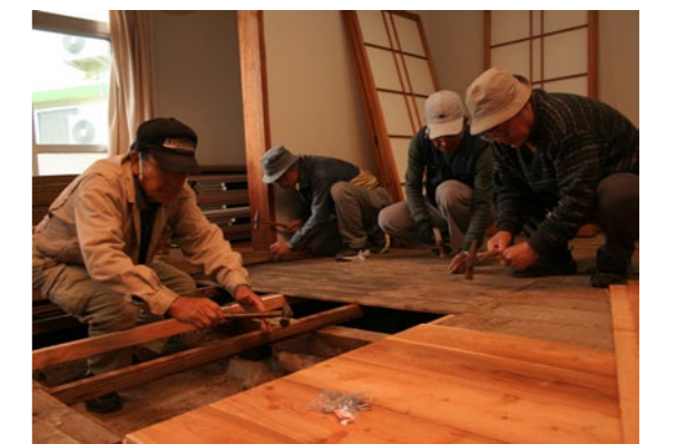
作業する中町地区老人クラブの皆さん

作業は12月4日から開始。経験者の指示のもと作業が進められ、畳の風通しも行って約10日間で作業が完了しました。