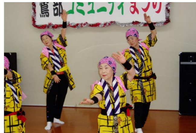
12/6(日) 鷺部コミュニティまつり (鷺部公民館)

当日は、人権作品入賞者の表彰や人権作文の意見発表、さくらの会(江田島町人権問題啓発活動推進者の会)による寸劇、鎌田 實さんの講演会が行われました。