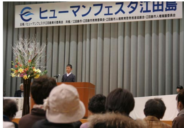
12/6(日) ヒューマンフェスタ江田島 (農村環境改善センター)

当日は、人権作品入賞者の表彰や人権作文の意見発表、さくらの会(江田島町人権問題啓発活動推進者の会)による寸劇、鎌田 實さんの講演会が行われました。