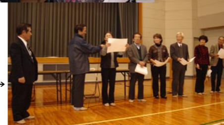
まちづくり宣言文を読み上げる参加者