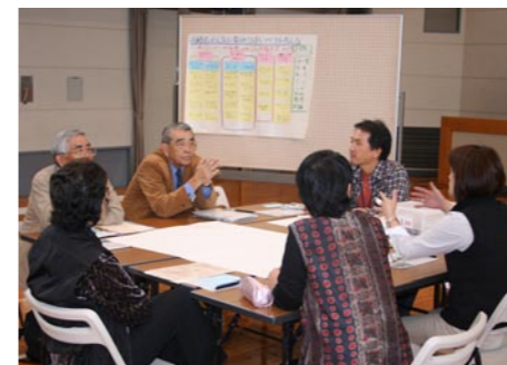
←ワークショップの様子

参加者は、各班に分かれて地域の問題解決の手法や計画づくりの方法を学び、最後に各班で考えたまちづくり宣言文を読み上げました。